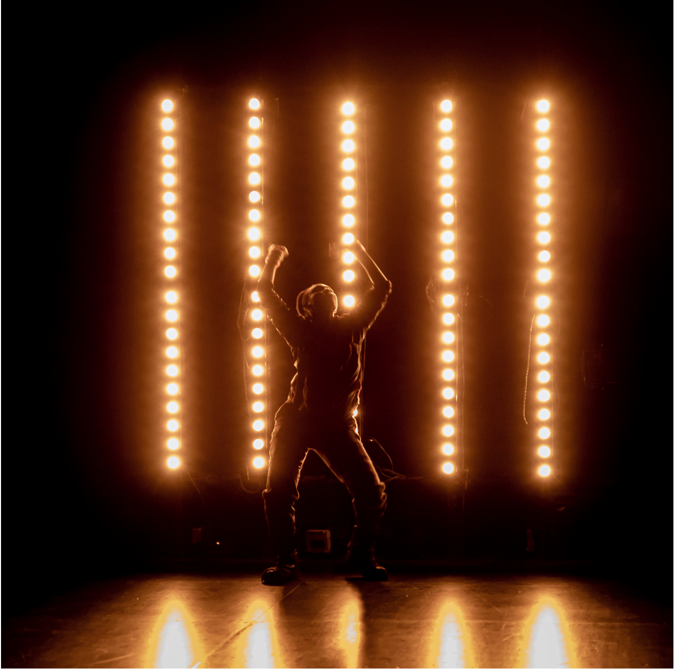
© Nicolas Martinez — Châteaueuallon, scène nationale