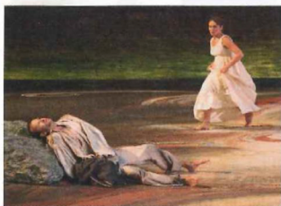
Iphigénie, héroïne féministe avant l'heure.