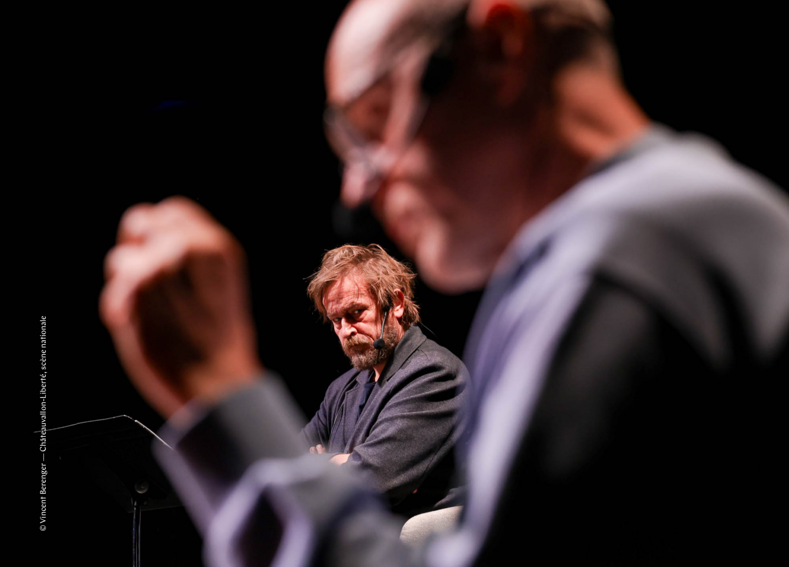
© Vincent Berenger — Châteaueuallon-Liberré, scéne nationale